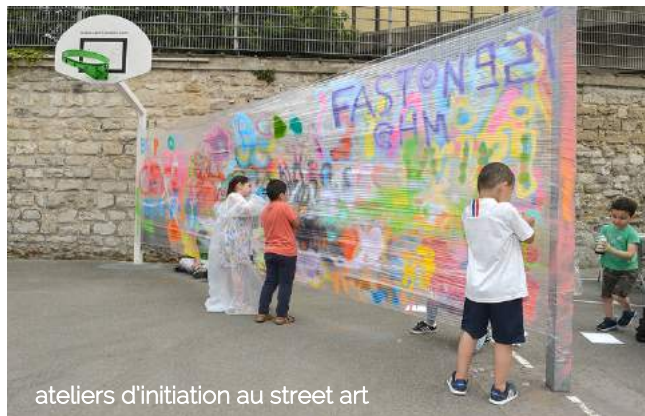
ateliers d'initiation au street art