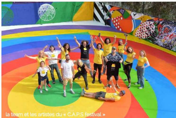
la team et les artistes du « C.A.P.S festival »

Le festival s'intègre dans un projet plus global que porte l'association CO42 et l'agence rentingART : la transformation d'une zone urbaine en transition attenante au terrain de sport en un centre d'art contemporain vivant, le CO42, un lieu de promotion de la création artistique sous une forme co-créative et collaborative inédite.