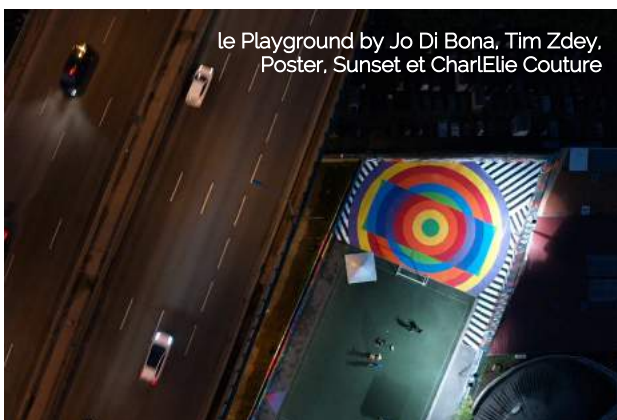
Le Playground by Jo Di Bona, Tim Zdey, Poster, Sunset et CharlElie Couture

La première édition du festival répond à son ambition : l'embellissement de l'entrée de ville de Clichy en créant un lieu d'art pérenne, un musée à ciel ouvert, qui donne accès à l'art à de nouveaux publics de façon inclusive . Le pari est rempli, les habitants et les jeunes du quartier sont spontanément venus aider les artistes et plus de 90 enfants ont participé aux ateliers d'initiation au street-art. Nous sommes ravis de l'impact social qu'a eu l'évènement . L'intérêt et l'implication des habitants ont permis la réussite du projet. Des liens nouveaux de cohésion sociale se sont créés grâce à l'art qui a été un vecteur d'échange fort.