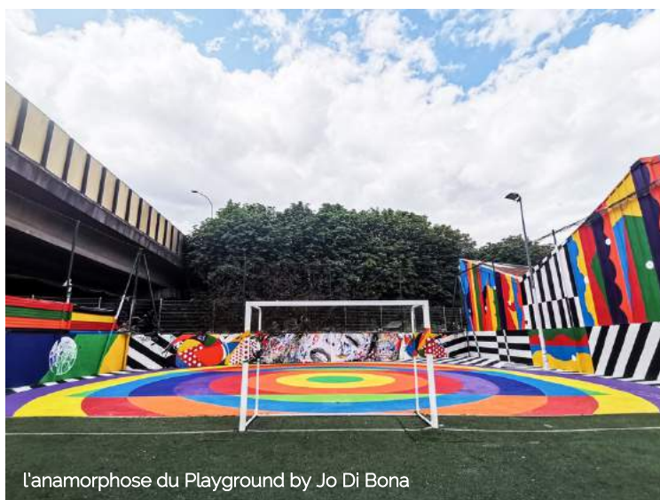
L'anamorphose du Playground by Jo Di Bona