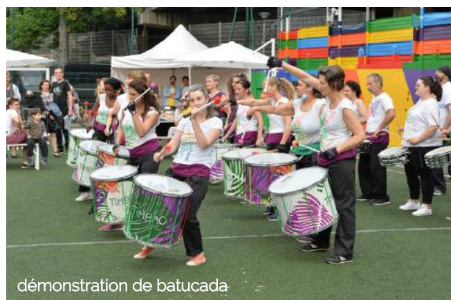
démonstration de batucada